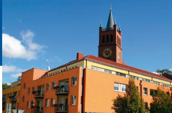
EHPAD Alzheimer - Müncheberg (Allemagne)*