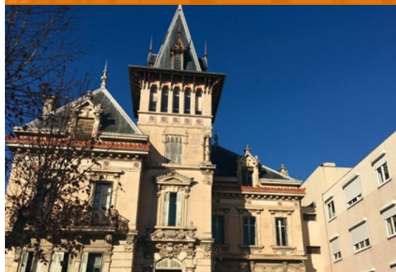
CLINIQUE MCO - Salon de Provence*