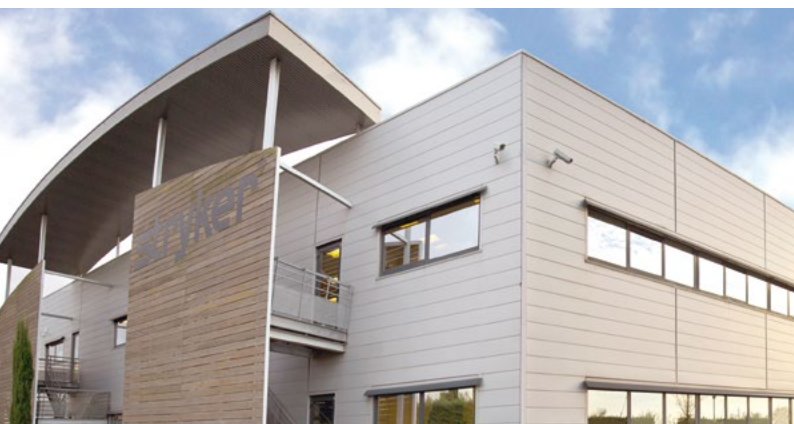
SIÈGE SOCIAL STRYKER - Pusignan (Lyon)*