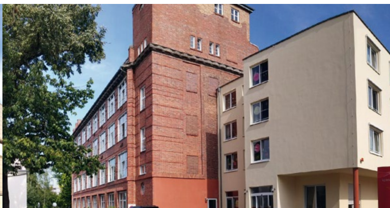
EHPAD Alzheimer - Guben (Allemagne)*