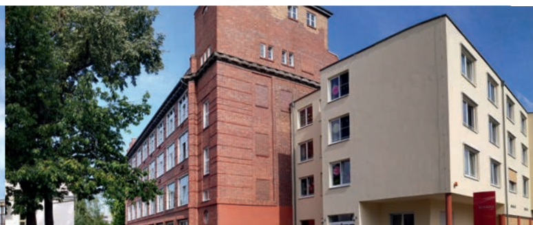
EHPAD Alzheimer - Guben (Allemagne)*