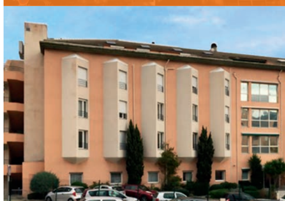
EHPAD Alzheimer - Bastia*

*Investissements déjà réalisés qui ne préjugent pas des investissements futurs.